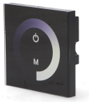
LM2181 Dimmer embutir Táctil Unicolor Para Fitas LED 12/24V