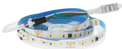
Tabela de Referências