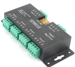
LM2091 Amplificador de sinal para Fita Led Digital