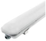
LM1105 Armadura Estanque LED Proline 18W 600mm CCT Vinculável CCT