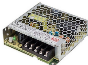
Tabela de Referências