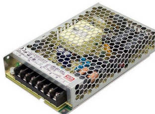
Tabela de Referências