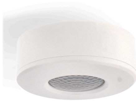
Tabela de Referências