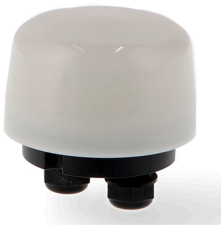
Tabela de Referências