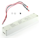
LM2128 Kit de conversão de emergência até 20W