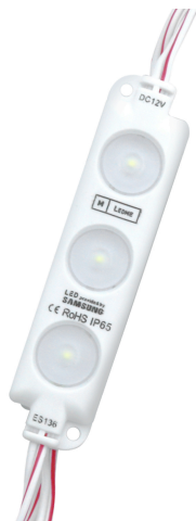
Tabela de Referências