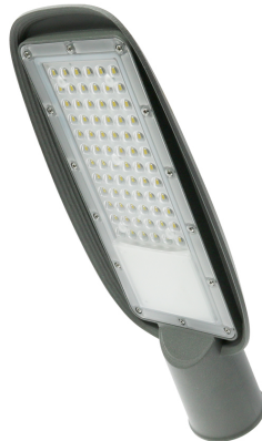
Tabela de Referências