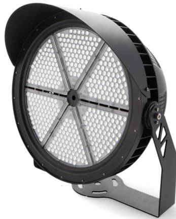
Tabela de Referências