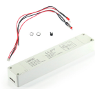
LM2128 Kit de conversão de emergência até 20W