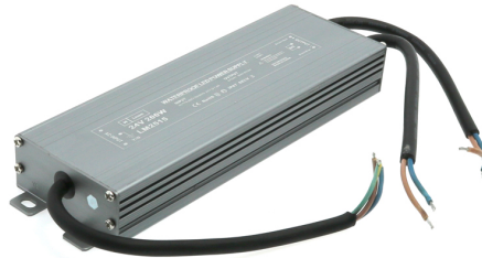
Tabela de Referências