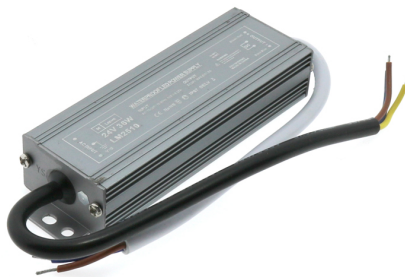
Tabela de Referências