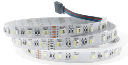
Tabela de Referências