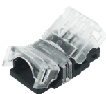
LM2911 Conector de hipopótamo para faixa de LED e cabo IP65 10MM 4PIN