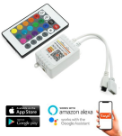
LM2187 Controlador mini SmartHome para fita led RGB com controle remoto por IR / APP