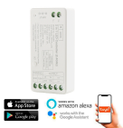
LM2082 Controlador de dimmer Smarthome LED monocolor/CCT