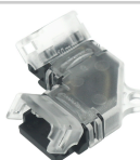
LM2918 Conector de hipopótamo L para faixa de LED IP20 10MM 4PIN