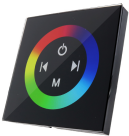
LM2182 Dimmer embutir Táctil RGB Para fitas LED 12/24V