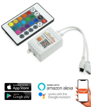
LM2187 Controlador mini SmartHome para fita led RGB com controle remoto por IR / APP