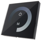
LM2181 Dimmer embutir Táctil Unicolor Para Fitas LED 12/24V