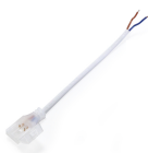
LM2038 Cabe adaptador c/ clip para fita LED 220VAC Ruzok