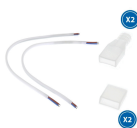
LM0004 Cabo Adaptador Para fita Led 220Vac Ruzok