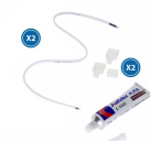
LM2359 Cabo Adaptador Para fita Led 220Vac Ruzok / Brescia