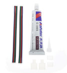
LM0043 Cabo Adaptador Para fita Led 220Vac Bergamo RGB