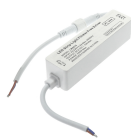
LM0015 Retificador de cintilação para tiras de led