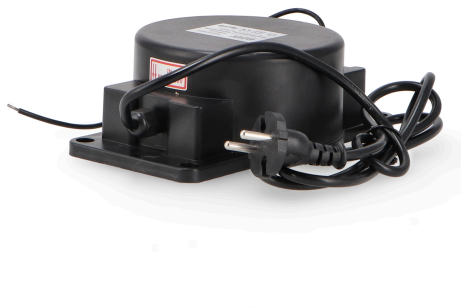
Tabela de Referências