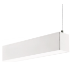
LM1187 Barra linear Trunk 40W (UGR 19) CCT CCT