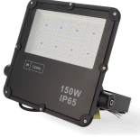
LM6573 Projetor LED Slim Series 150W 5000K