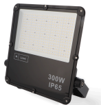
LM6580 Projetor LED Slim Series 300W 4000K