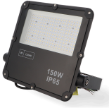
LM6574 Projetor LED Slim Series 150W 4000K