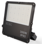
LM6579 Projetor LED Slim Series 300W 5000K