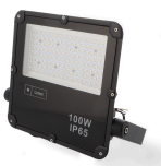
LM6570 Projetor LED Slim Series 100W 5000K