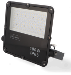
LM6571 Projetor LED Slim Series 100W 4000K