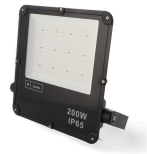
LM6577 Projetor LED Slim Series 200W 4000K