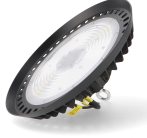
GA6766 Campânula UFO LED Serie A 200W 1-10V 4000K